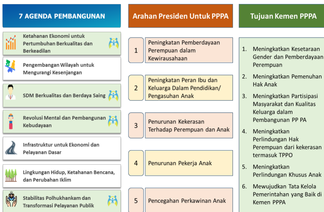
Gambar 3.1 Skema Perumusan Tujuan Kemen PPPA